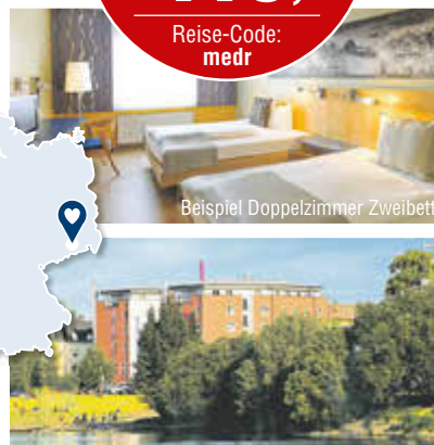
Beispiel Doppelzimmer Zweibett