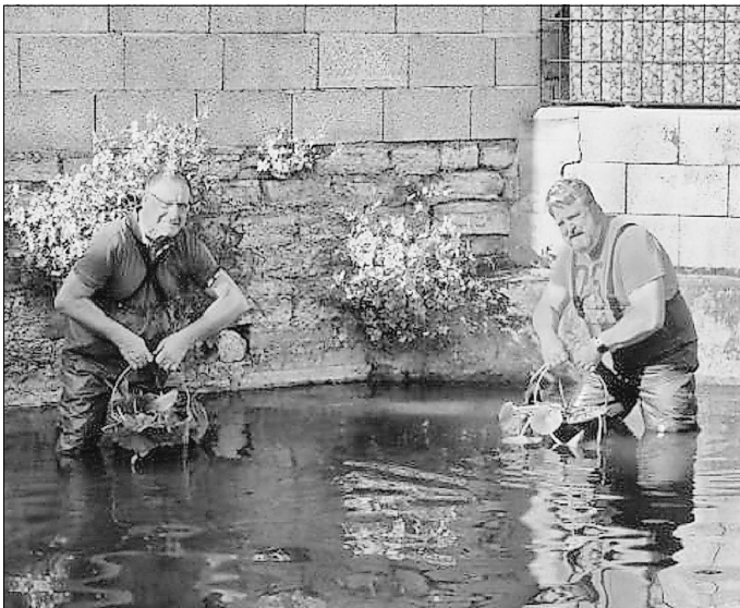
Seerosen werden eingesetzt