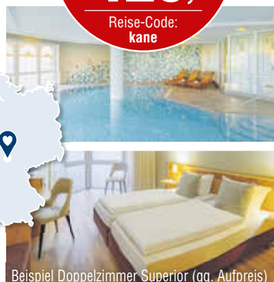
Beispiel Doppelzimmer Superior (gg. Aufpreis)