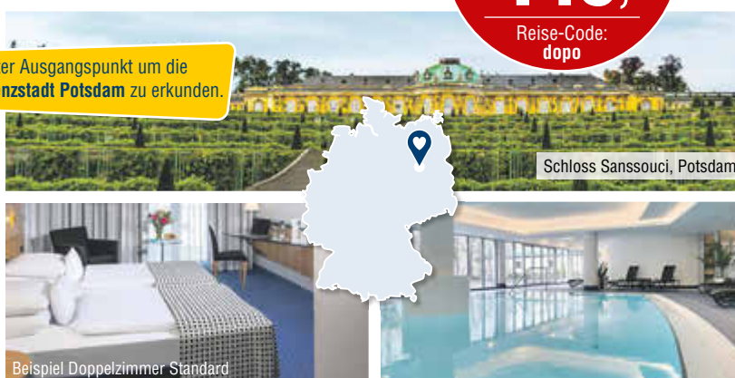
Schloss Sanssouci, Potsdam