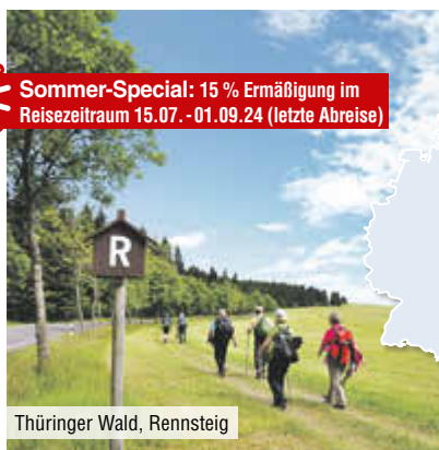
Thüringer Wald, Rennsteig